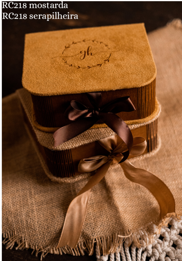
RC218 mostarda RC218 serapilheira